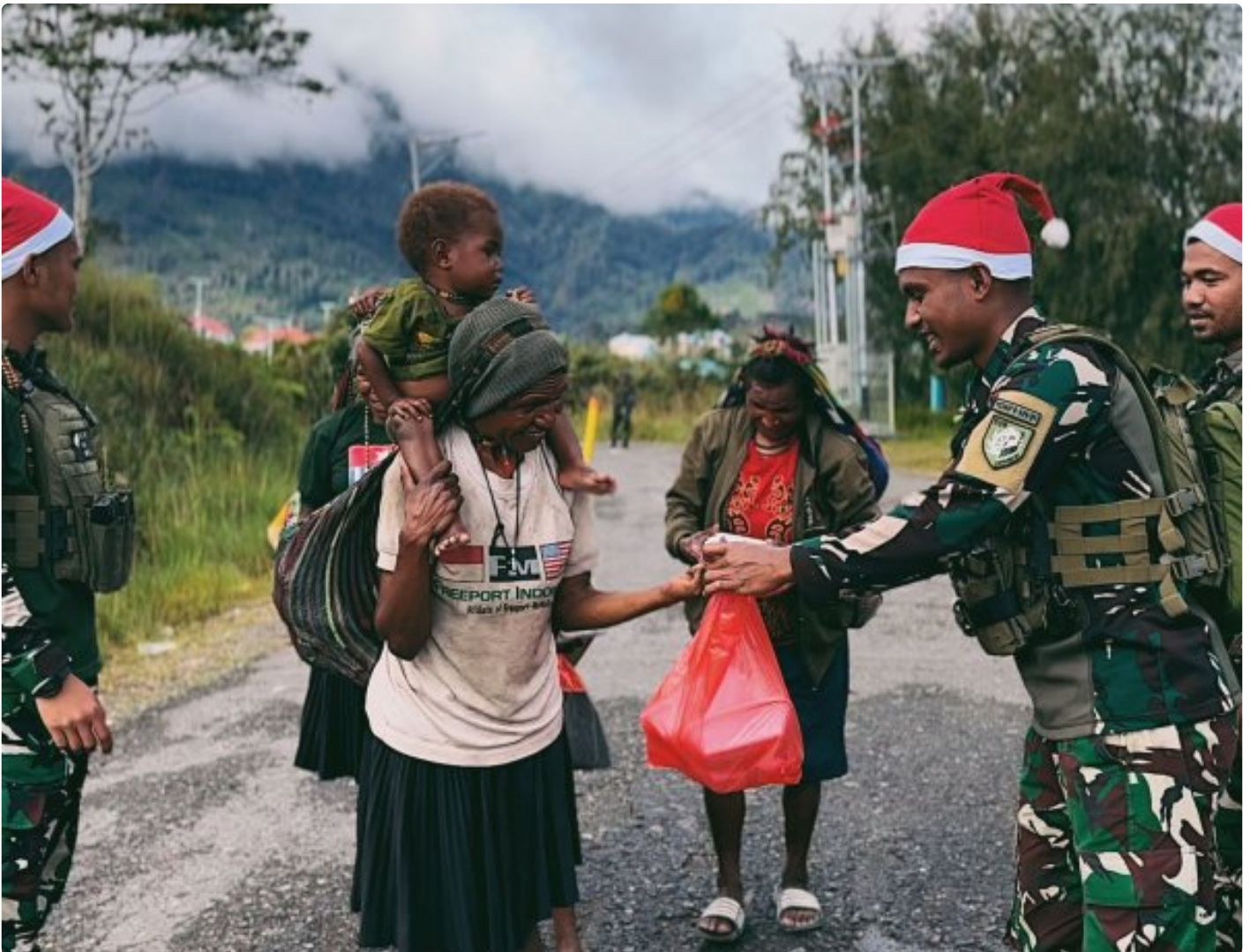
Foto: Satgas Yonif 509 Kostrad memberikan makna baru pada patroli keamanan dengan berbagi kebahagiaan bersama masyarakat di Intan Jaya, Papua.