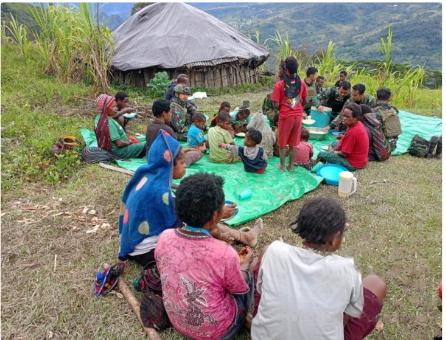
Personel Pos Pintu Jawa melaksanakan Makan Siang Bersama Masyarakat Kampung Wombru

Ada beragam cara untuk berkomunikasi sosial sekaligus berbagi kasih dengan sesama, Salah satunya seperti yang dilakukan oleh personel TNI yang tengah bertugas di pedalaman Papua. Yah, para personel TNI dari Satgas Mobile Yonif